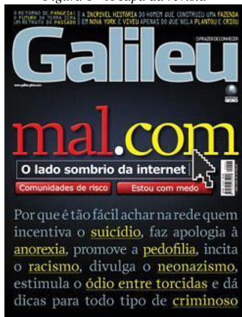
Figura 1 - A capa da revista

Em terceiro lugar, e mais importante, é preciso salientar que o discurso de ódio cresce de maneira abundante na internet, no mundo todo. Dentro desse discurso de ódio, o discurso racista, nazista e negacionista exigem dos educadores um preparo ainda mais específico.