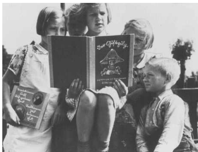
Crianças alemãs lendo o livro Der Giftpilz