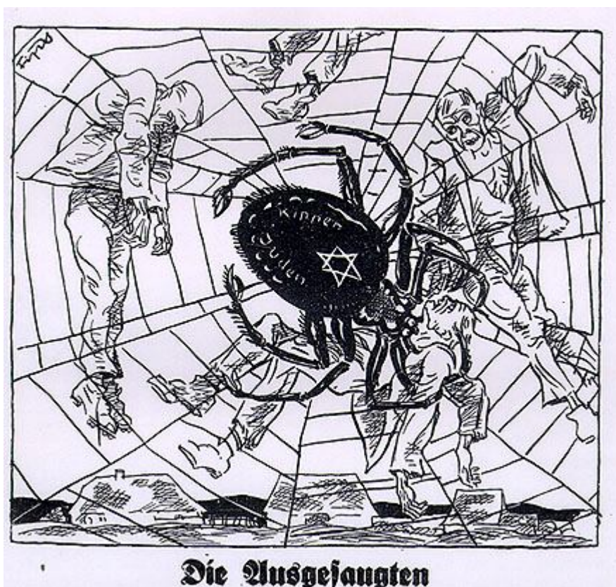
Fevereiro de 1930 – caricatura do Jornal Der Sturmer sugerindo que os judeus "enredam" a vida econômica dos alemães e os compara a criaturas desumanas e indesejáveis.

Para dar força a esse pensamento, o Partido Nazista fazia uso do jornal Der Sturmer . Este era um semanário nazista publicado por Julius Streicher de 1923 até o fim da Segunda Guerra Mundial em 1945, com breves interrupções de circulação devido a dificuldades legais. Foi parte significativa da máquina de propaganda nazista e era veementemente antissemita. Diferentemente do Volkischer Beobachter , o jornal oficial do partido que dava a si mesmo uma aparência extremamente séria. Der Sturmer fazia o estilo tablóide e frequentemente publicava material como caricaturas antissemitas e acusações de cunho panfletário contra os judeus. E tinha como objetivo conquistar o público da classe baixa.