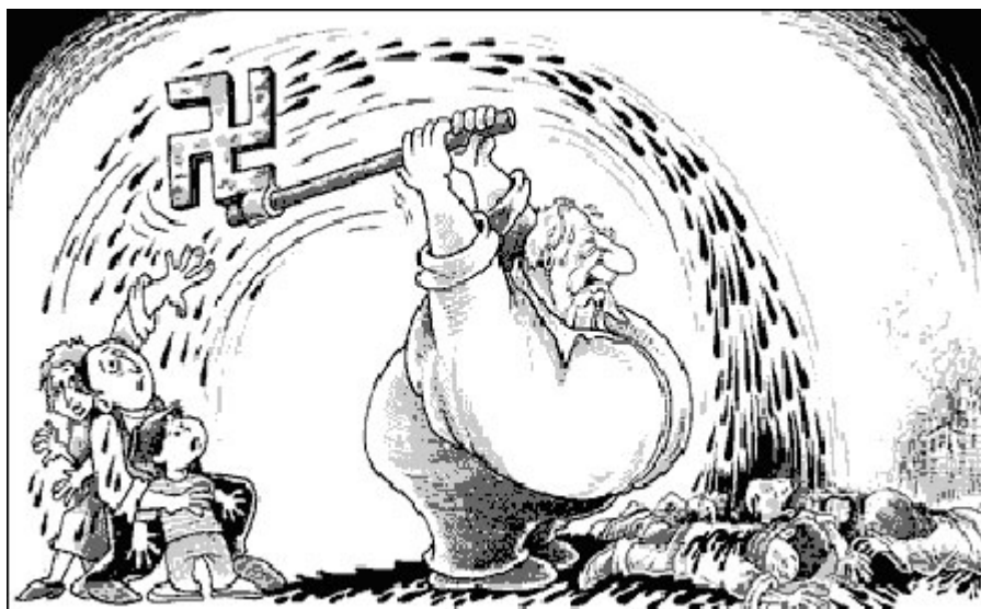
Do Jornal Arab News de 10 de abril de 2002

O antissemitismo está no mundo virtual. O que acontece é a propagação das idéias de forma mais ampla e incontrolada, podendo assim trazer novos “adeptos” no mundo real. O crescimento de um está diretamente ligado ao crescimento do outro. Esse mundo virtual pode levar o homem a interiorizar a mensagem de forma positiva ou negativa. O número de sites que expressam ódio religioso, preconceito e racismo aumentou dramaticamente desde o início de 2005. É difícil estimar o número de visitantes a estes sites e também não podemos avaliar quantos desses visitantes os tomam a sério; não obstante, os especialistas que examinaram o assunto argumentam que o antissemitismo na Internet está crescendo a olhos vistos.